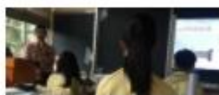
海洋生物多樣性障礙 單元學習單 新北市民立高第4年級國語 國家自然科點