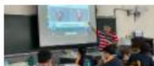
kubook 新北市民立雙溪國中 國語國文科點