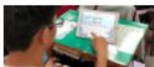
nearpod 新北市民立高第4年級國語 國家自然科點