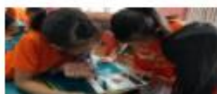
世界歐英英語單字與會詞對照 臺南市立雙溪國中 國語國文科點